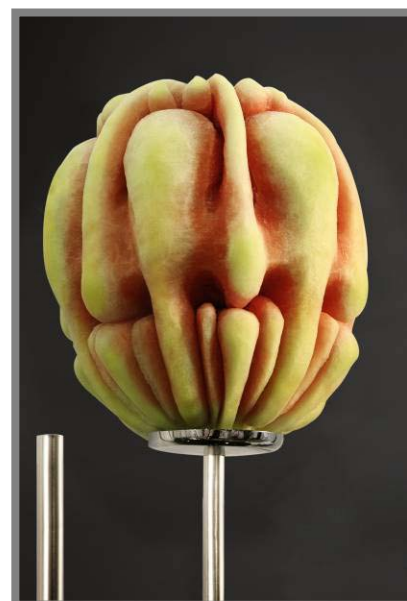
Détail du Lac Noir Tranquille

éphémère, sculpteurs de fruits www.ephemart.com T.514.274.2313